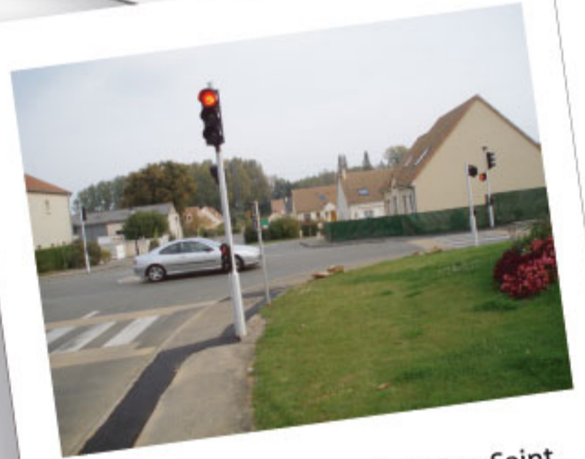
Feu tricolore au carrefour Rue Saint Jacques et Rue des Vignes