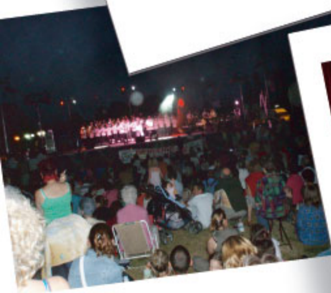
Fête de la musique samedi 23 juin 2007