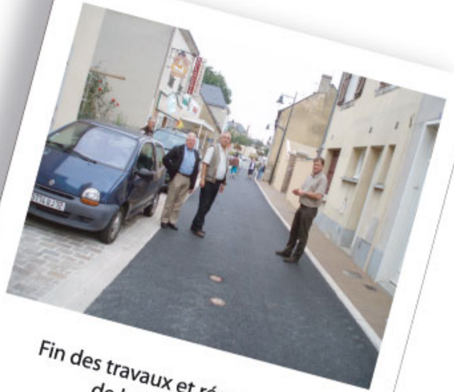
Fin des travaux et réouverture de la Grande rue