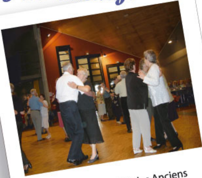
Repas du comité des Anciens le dimanche 07 octobre