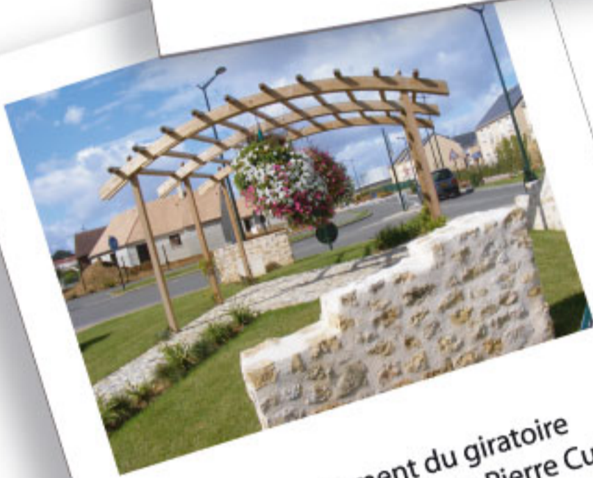
Aménagement du giratoire RD92 / Avenue Marie et Pierre Curie