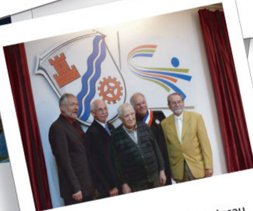
10 ans du jumelage à Ludwigsau le 06 et 07 octobre