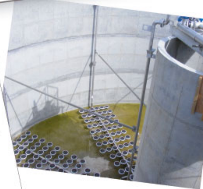
Bassin d'aération type "fines bulles"